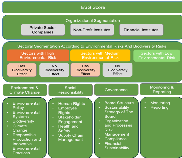
Şekil 1 - CGE Evaluation ÇSY Performans Değerlendirme Kapsamı

Metodoloji, ÇSY performansını dört temel sütun kapsamında değerlendirmektedir: